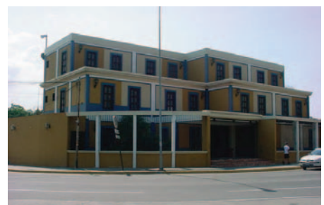
Centro Empresarial Marítimo Pto. Cabello