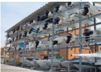
Gran Marina del Rey